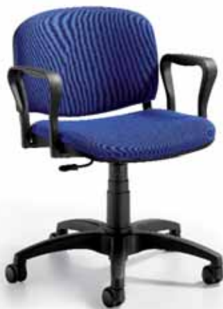
Versione 900 girevole imbottita c/bracc. 900 swivel upholstered version w/arms