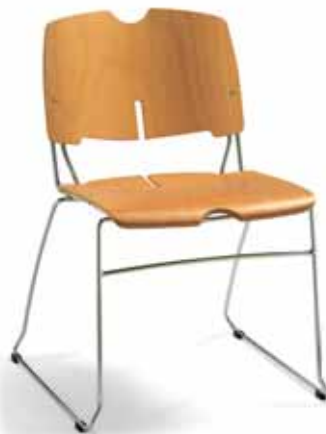
Versione 910 in legno 910 wooden version