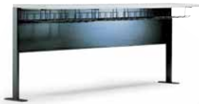
Tavolo 900 con pannello 900 table w/panel