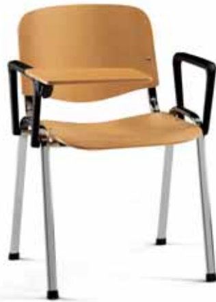
Versione 900 in legno c/bracc. e tavoletta 900 wooden version w/arms and writing tablet