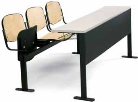
Versione 900 panca ribaltabile da imbottire 900 tip-up bench to be upholstered version