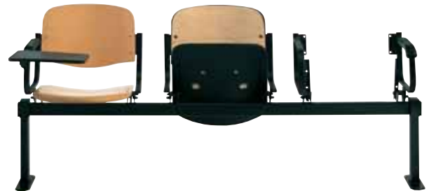
Versione 900 panca ribaltabile da imbottire con tavoletta 900 tip-up bench to be upholstered version w/writing tablet