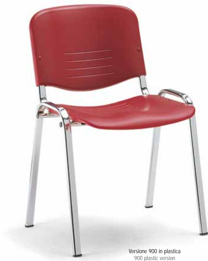
Versione 900 in plastica 900 plastic version

Le idee di chi crea al servizio di chi arreda. Creative furnishing ideas.