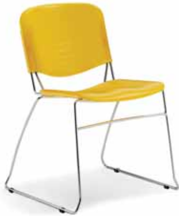
Versione 910 in plastica 910 plastic version