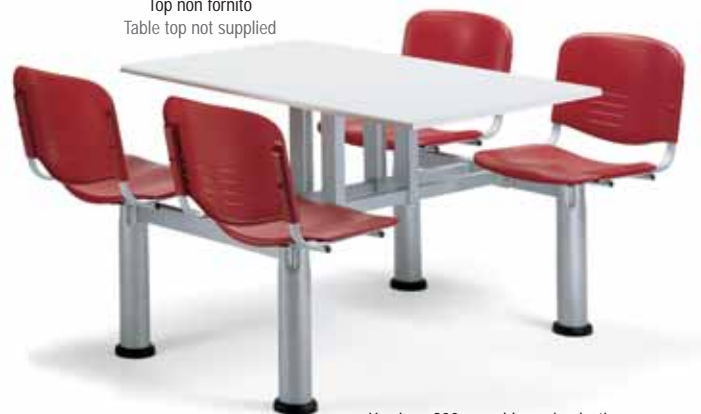
Versione 900 monoblocco in plastica 900 plastic enbloc frame version