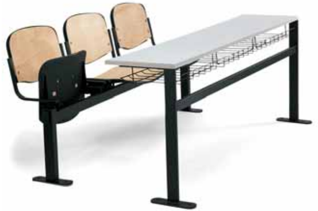
Versione 900 panca ribaltabile da imbottire 900 tip-up bench to be upholstered version