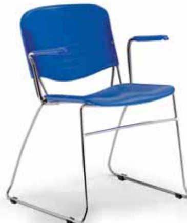
Versione 910 in plastica c/bracc. 910 plastic version w/arms