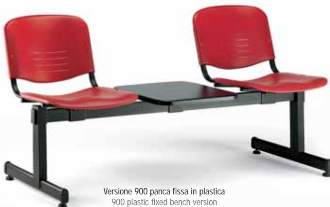
Versione 900 panca fissa in plastica 900 plastic fixed bench version