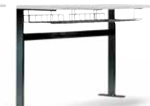
Tavolo 900 senza pannello 900 table w/out panel