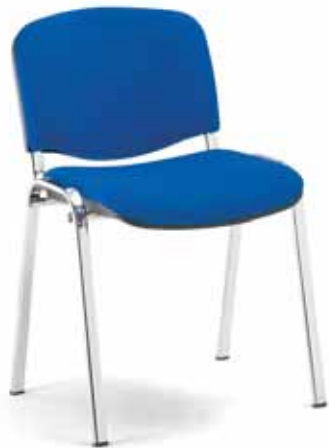
Versione 900 imbottita 900 upholstered version