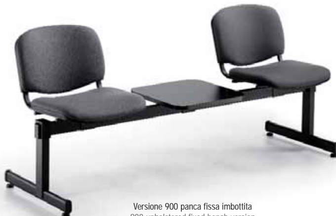
Versione 900 panca fissa imbottita 900 upholstered fixed bench version